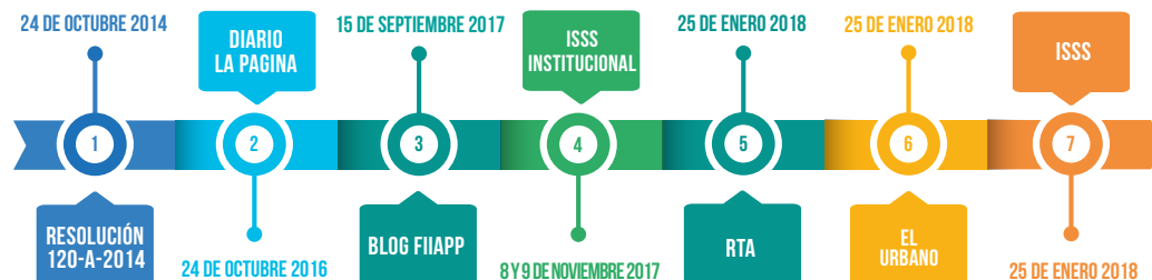
Ilustración 4. Línea de tiempo. Expediente clínico

Elaboración propia con datos obtenidos en diferentes sitios web