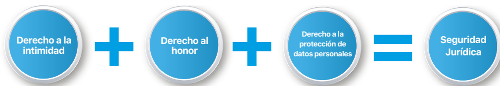
Ilustración 2. Relación del Derecho de Protección de Datos Personales

Como podemos observar, nuestros datos personales son tan importantes que, tanto a nivel internacional como a nivel nacional, se reconoce el derecho de protección. Para efectos de mejor comprensión de la importancia que tiene este derecho, vamos a ver el siguiente esquema que nos muestra la relevancia versus otros derechos: