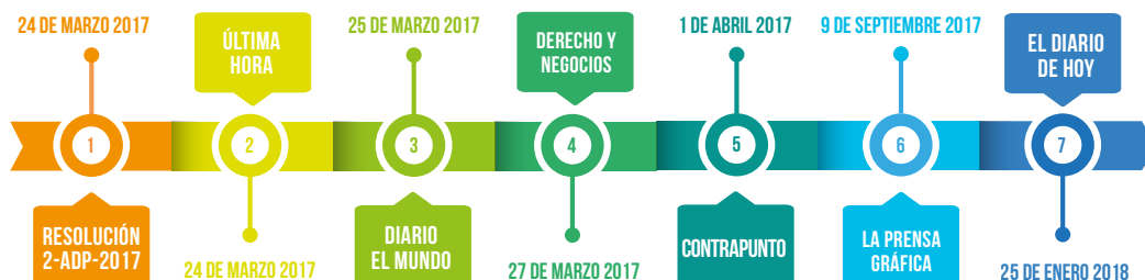
Ilustración 5. Línea de tiempo. Antecedentes policiales