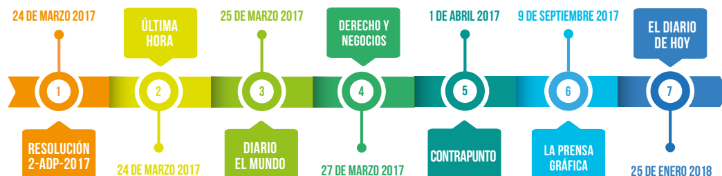
Ilustración 5. Línea de tiempo. Antecedentes policiales