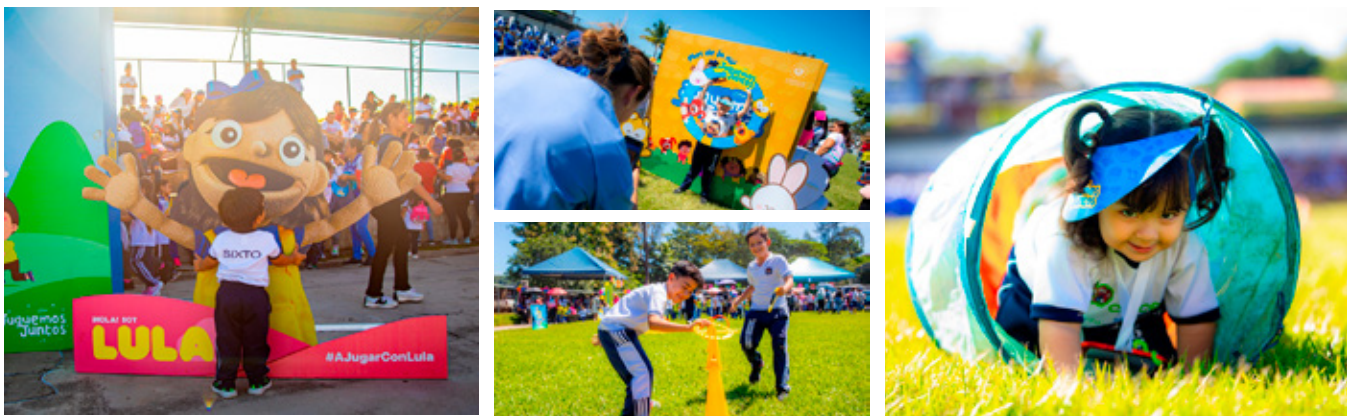
15 de octubre, Estadio "Mauricio Vides" en Ilobasco, Cabañas.