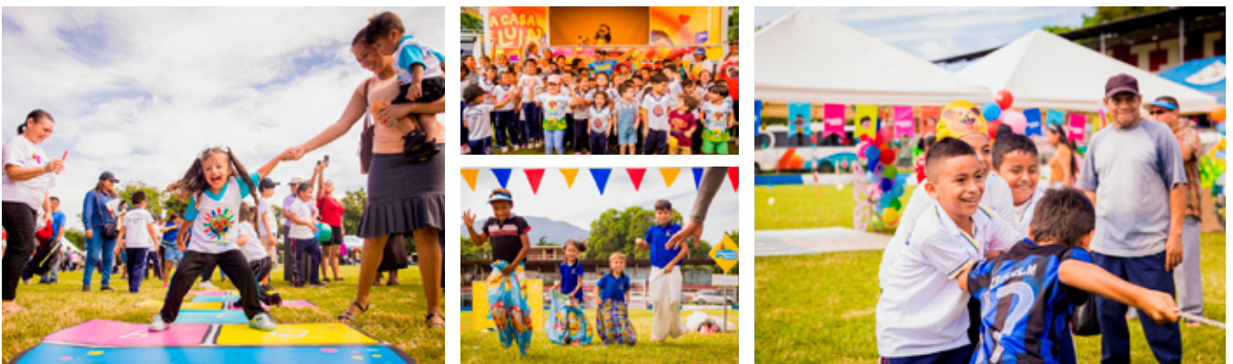
12 de octubre, Estadio "Marcelino Imbers", La Unión.