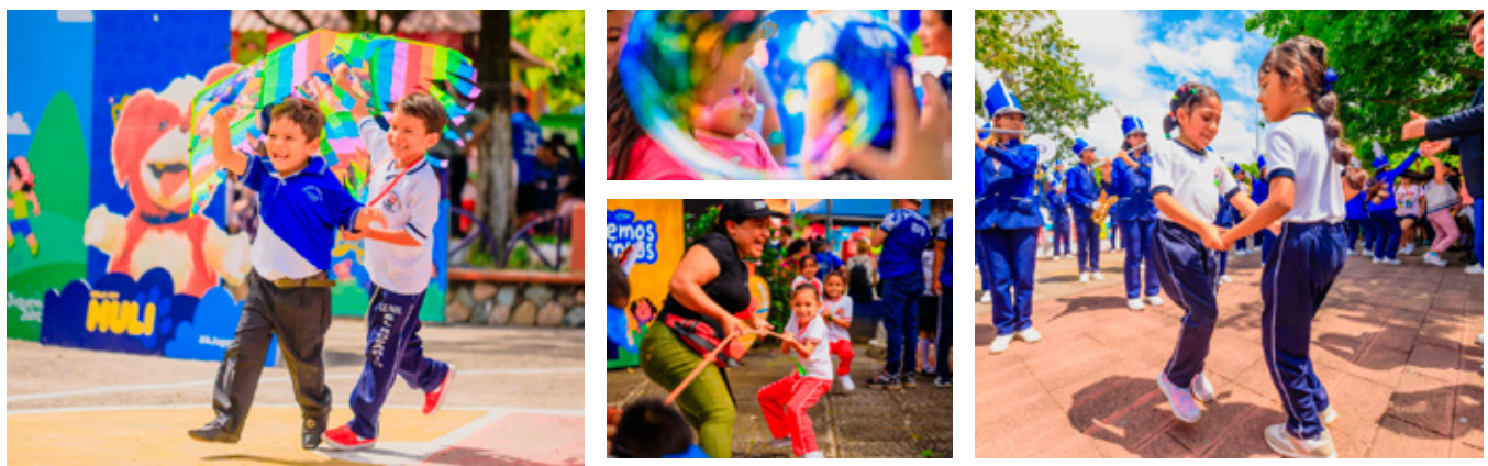
18 de octubre, Parque "El Rosario", Rosario de La Paz, La Paz.