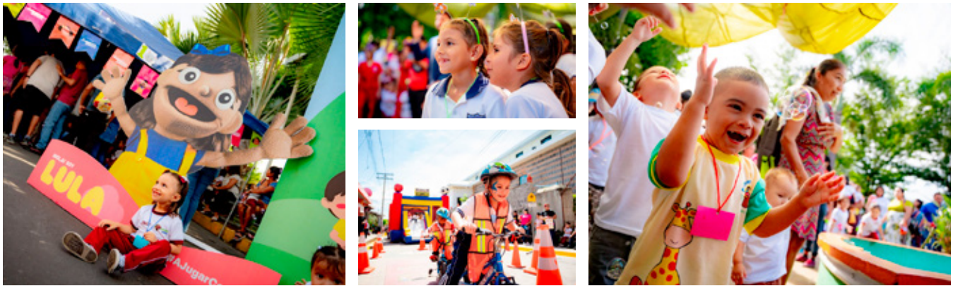
14 de octubre, Parque Central "Distrito Apastepeque", San Vicente.