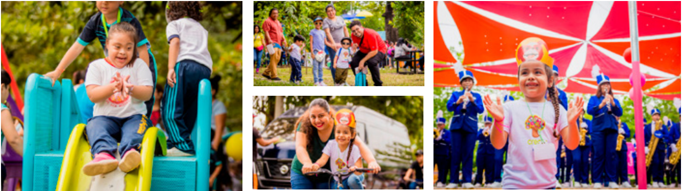
10 de octubre, Parque de "Colonia Ciudad Pacífica", Distrito de San Miguel.