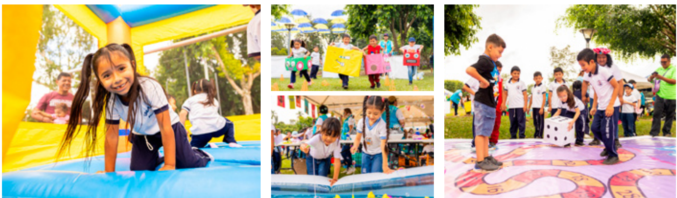
30 de octubre, Parque "El Cafetalón", Santa Tecla, La Libertad.