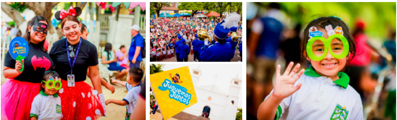
9 de octubre, Parque Central "Raúl Francisco Munguía", Usulután.