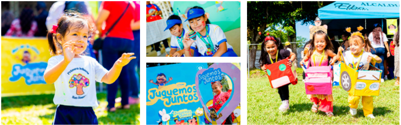
17 de octubre, Cancha de "Santa Cruz Michapa", Cuscatlán.