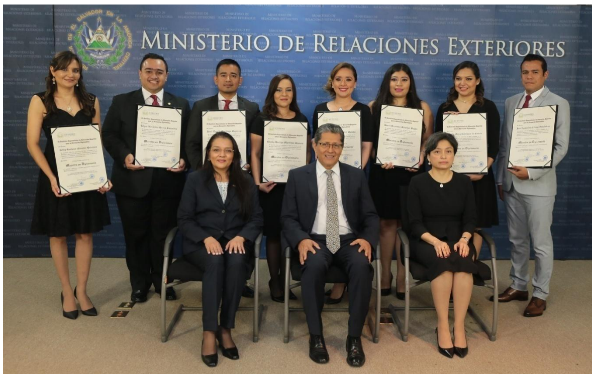
Imagen de Graduados de Maestría en Diplomacia, 30 de junio de 2017