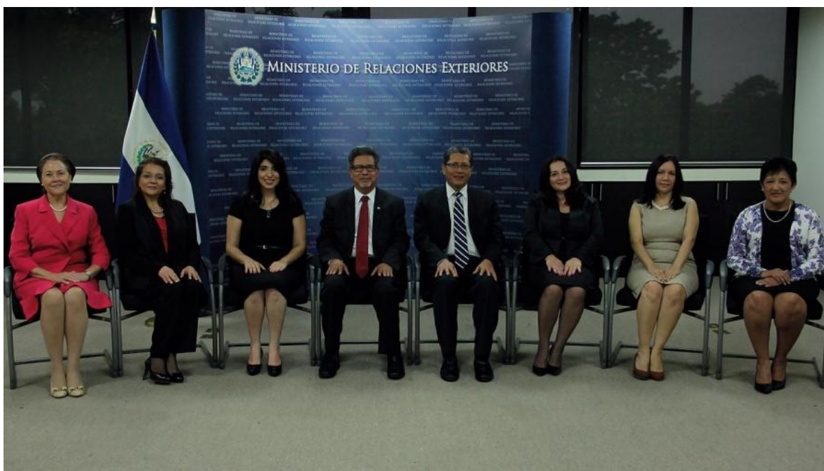
Imagen de Graduados de Maestría en Diplomacia, 24 de junio de 2016