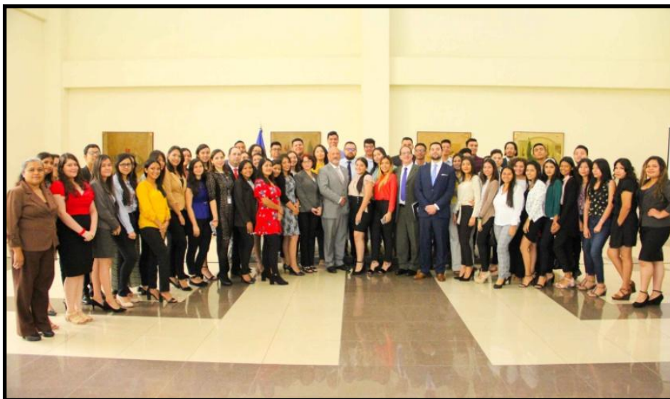
Imagen relativa al Simposio denominado La diplomacia salvadoreña en el marco del centenario de las Relaciones Internacionales , 30 de octubre de 2019, como actividad de proyección social del IEESFORD, Salón de Honor del Ministerio de Relaciones Exteriores de El Salvador.

Son actividades de carácter académico-diplomático, en las que se incluyen temas específicos relacionados con la Diplomacia y las Relaciones Internacionales, cuyo alcance es general y está abierto para el público interesado.