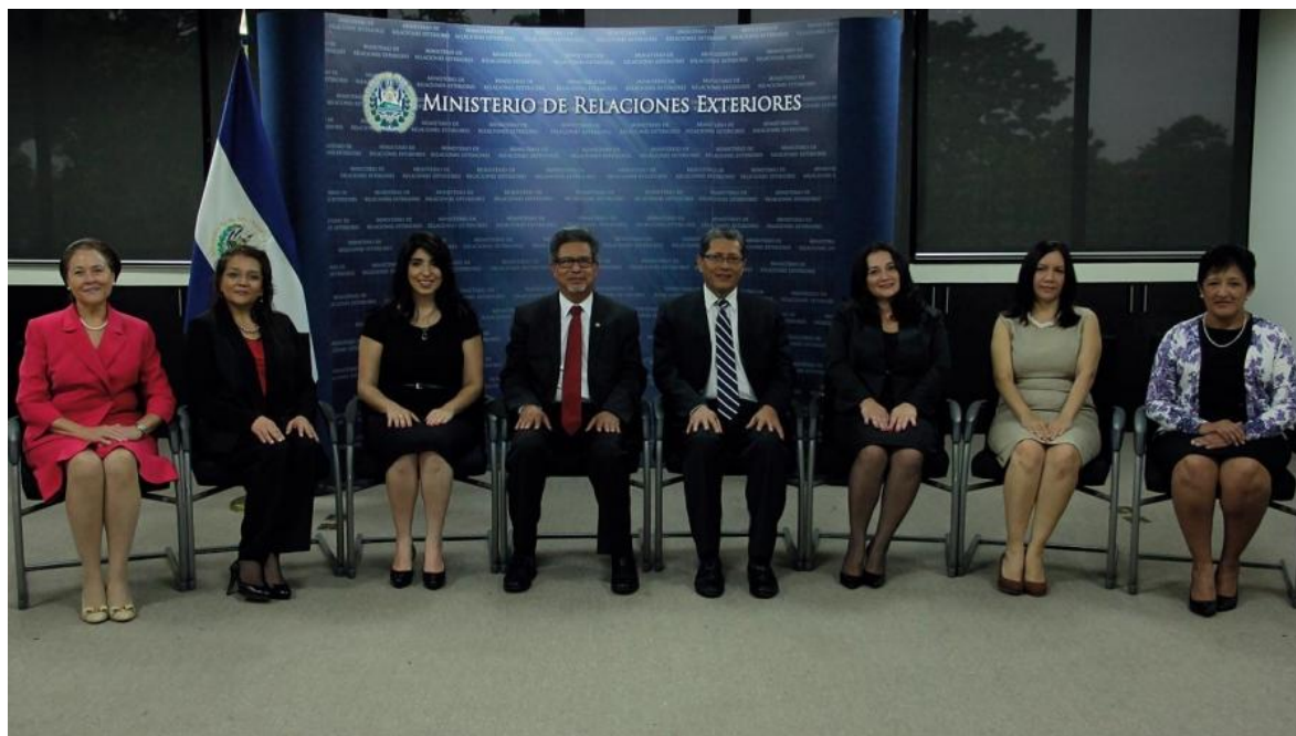
Imagen de Graduados de Maestría en Diplomacia, 24 de junio de 2016