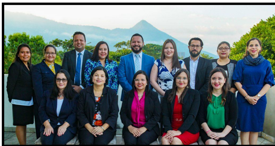
Graduados del IEESFORD de diferentes cohortes