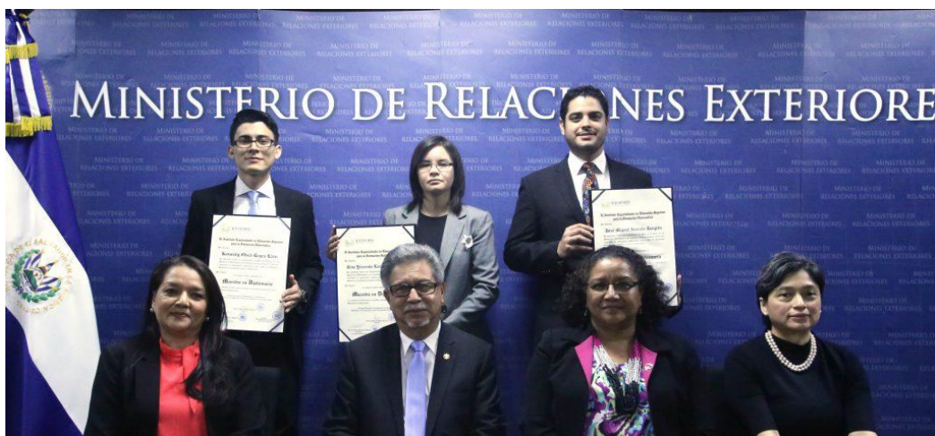
Imagen de Graduados de Maestría en Diplomacia, 20 de diciembre de 2018