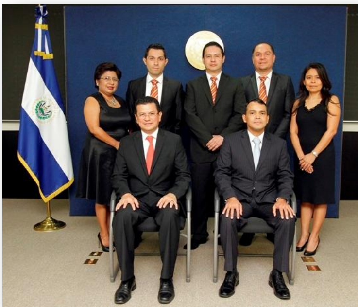
Imagen de Graduados de Maestría en Diplomacia, 29 de agosto de 2014

A la fecha, el IEESFORD cuenta con 28 graduados, para los cuales se han celebrado cuatro actos de graduación. Este Instituto promueve la participación de sus graduados en las diferentes actividades académicas que realiza, a la vez se les ha promovido para desempeñarse como docentes de cursos cortos especializados, asignaturas de la Maestría en Diplomacia, así como jurados de tesis, entre otros.