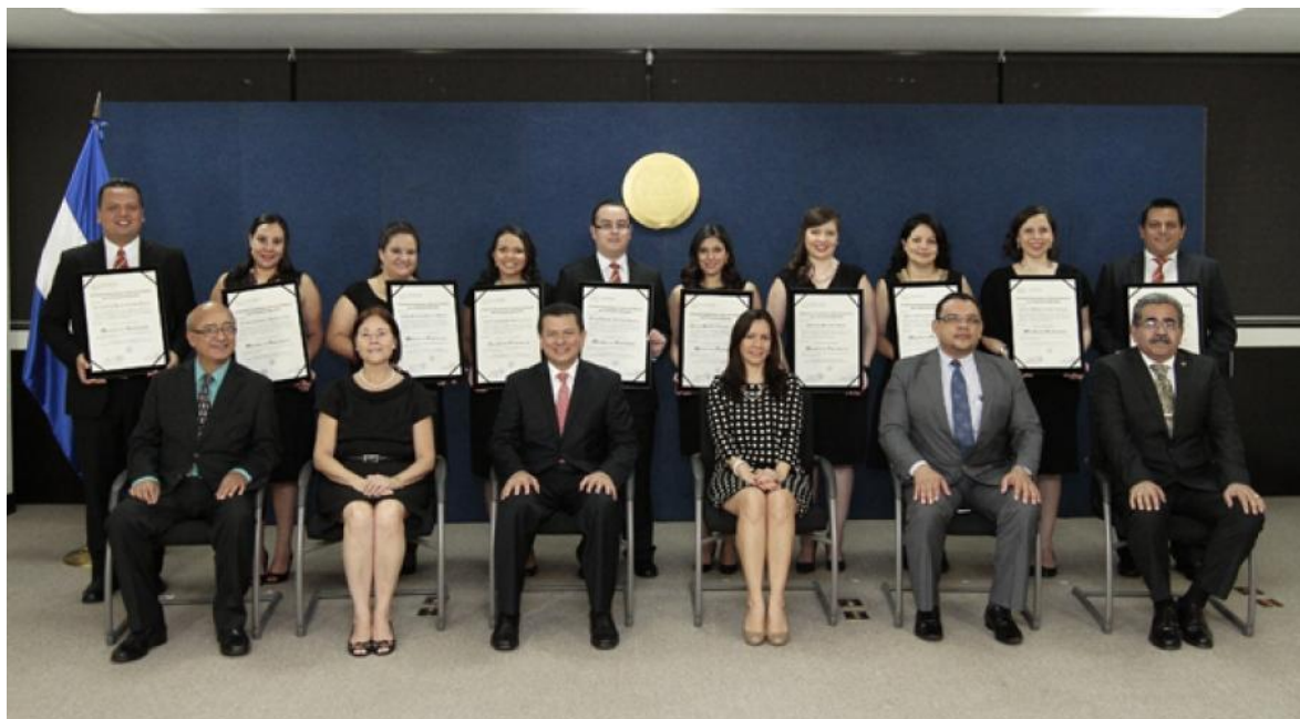
Imagen de Graduados de Maestría en Diplomacia, 23 de diciembre de 2014