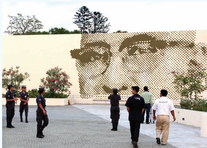
Mural La Mirada de Monseñor Romero ubicado en la sede de Cancillería

Con el propósito de dotar a los diplomáticos de carrera y a los funcionarios del Ministerio de Relaciones Exteriores de una formación académica acorde a las exigencias de la diplomacia y de las relaciones internacionales contemporáneas, el Ministerio de Relaciones Exteriores creó en 2010, el Instituto Especializado de Educación Superior para la Formación Diplomática (IEESFORD). Actualmente, se cuenta con el primer grupo de 17 egresados de la Maestría en Diplomacia impartida IEESFORD. Una segunda generación de 25 estudiantes participa de dicha maestría.