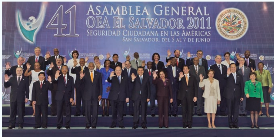
El Salvador fue sede de la 41 Asamblea General de la OEA en junio de 2011.

Durante la administración del presidente Mauricio Funes, el Ministerio de Relaciones Exteriores mantuvo una política exterior abierta al mundo, promoviendo al país como una nación soberana, líder y propositiva en temas relevantes a escala mundial.