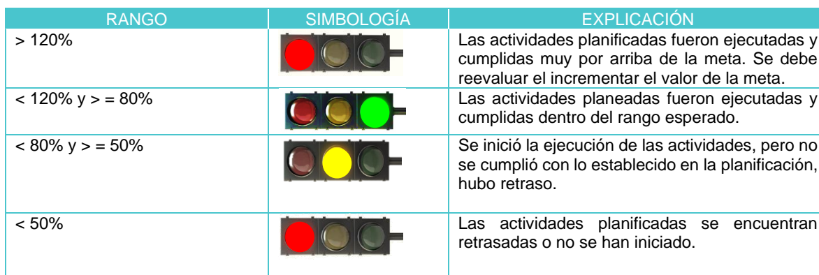
Tabla 2. Interpretación colorimétrica de los rangos de cumplimiento. Fuente elaboración de la Gerencia de Asuntos Estratégicos.