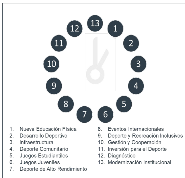
Figura 2. Programas estratégicos del INDES..