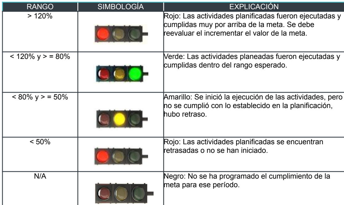
Tabla 2. Interpretación colorimétrica de los rangos de cumplimiento.

La interpretación de los indicadores de cumplimiento se realizó en base a la siguiente tabla: