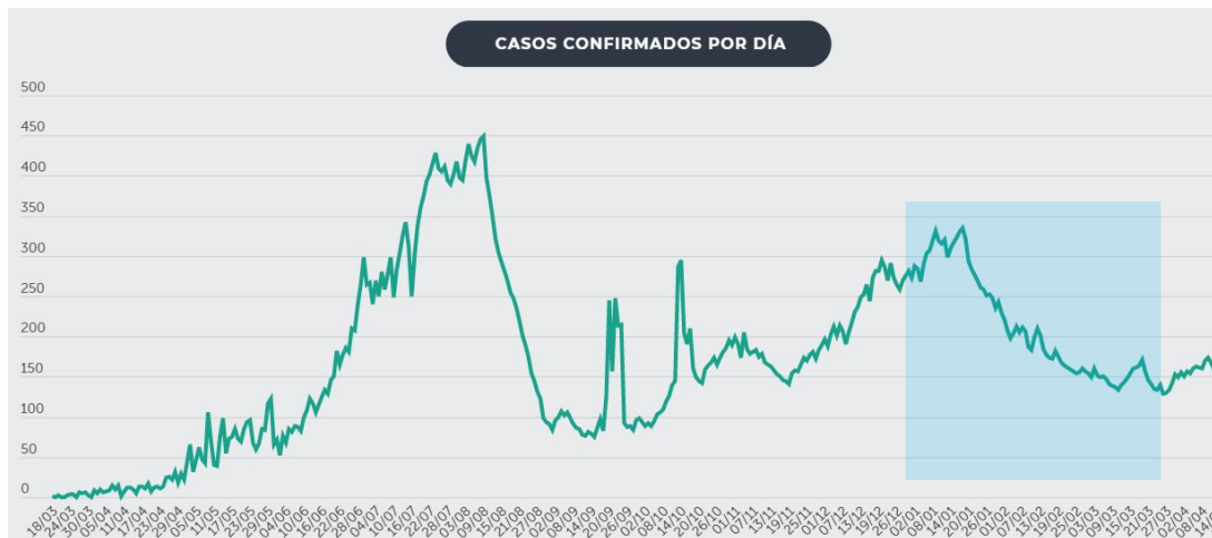
Figura 1. Casos confirmados de COVID 19 por día en El Salvador.

Este seguimiento refleja el trabajo institucional durante el periodo.