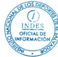
Lic. Carlos Eduardo Ceceña Grande Oficial de Información Instituto Nacional de los Deportes de El Salvador