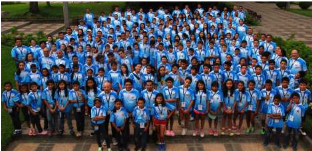
Las principales autoridades del INDES, acompañaron a los atletas en las diferentes competencias como muestra de apoyo.

El Salvador logró un buen cierre en los VI Juegos Deportivos Estudiantiles del CODICADER, nivel primario, que se llevaron a cabo en Retalhuleo y Mazatenango, Guatemala, en el mes de julio.