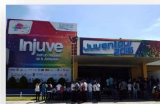
Evento de Inauguración de Juventour 2015