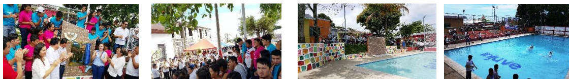
Inauguración Centro Juvenil de Berlín, Usulután

Esta obra consistió en la remodelación de la fachada principal, del área administrativa, de las aulas de capacitación, del salón de usos múltiples, de la reconstrucción de la cancha de baloncesto/ fútbol sala, construcción de piscina y duchas, la rehabilitación de servicios sanitarios, reconstrucción de cisterna, rehabilitación de la red eléctrica interna y externa en general, construcción de estacionamiento, entre otras mejoras. Y fue inaugurada en el mes de mayo de 2016, en un acto en el cual participaron más de 2,000 personas incluyendo a autoridades del departamento, en el programa del evento se contó con la presentación de grupos artísticos, bandas de paz, stands institucionales. La inversión ascendió a $262,335.36.