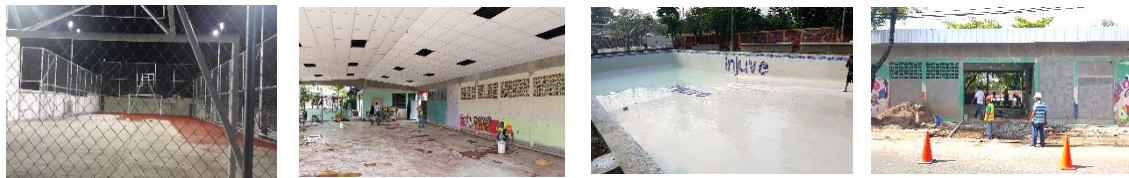
Trabajos de Remodelación en el Centro Juvenil San Francisco Gotera, Morazán

La obra se espera sea inaugurada en el mes de agosto del presente año, en el marco de la Ruta Juventour 2016, a realizarse en el mes de agosto. Con una inversión que asciende a más de $ 300, 000.00.