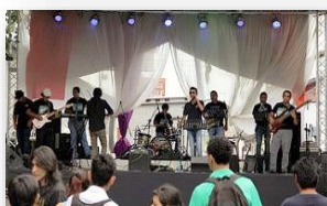
Presentación de Grupos Musicales