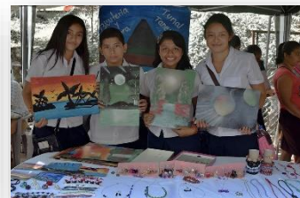
Feria de Jóvenes Emprendedores