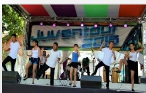
Presentación de Grupos de Danza Moderna