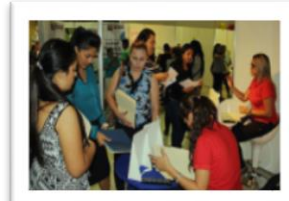
Feria Jóvenes Emprendedores/as