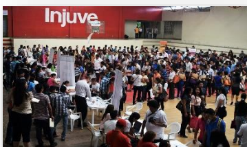
Feria de Empleo Juvenil