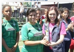
Feria de Jóvenes Emprendedores