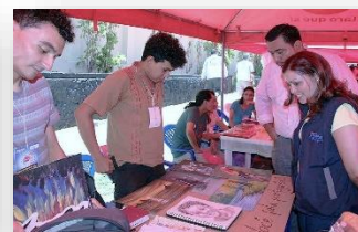
Recorrido de autoridades en los pabellones del CIFCO