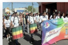
Desfile de Bandas de Paz y Batucadas