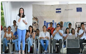
Inauguración, Ruta hacia JUVENTOUR, Zona Occidental