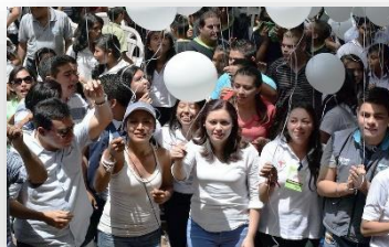
Presentación Orquesta de Cuerdas