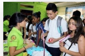
Charlas sobre Salud Sexual y Reproductiva