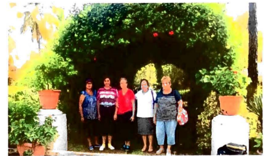
Excursión a Centro Recreativo "El Siloe" Ahuachapan