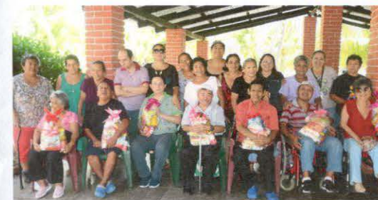
Convivio de Pensionados Dependientes y Cuidadores en Centro Recreativo Costa del Sol