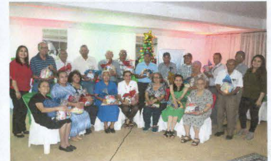
Celebración de Fiesta Navideña a Pensionados y Pensionadas de Usulután