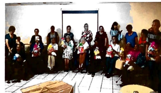
Celebración de Adulto Mayor Centenario