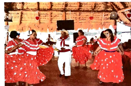
Pensionados y Pensionadas de San Miguel en Convivio del Día del Amor y la Amistad

Elaboración: Unidad de Planificación y Gestión de Calidad