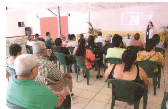
Charla Médica en San Sebastian, San Vicente