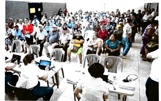
Las Pensionadas y Pensionados asistieron a Firma de Sobrevivencia en Municipio de Zacatecoluca, La Paz.