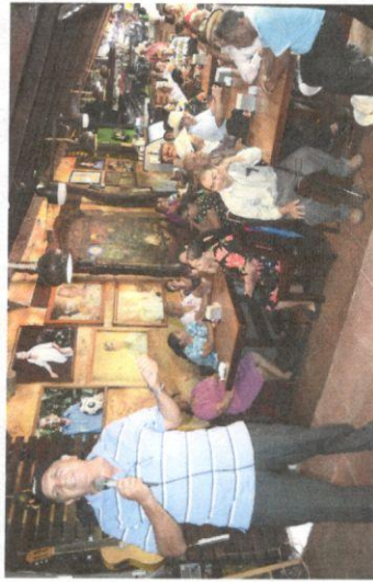
Celebración del día de la Madre y día del Padre a Pensionados y Pensionadas de en Oficina Departamental de Morazán