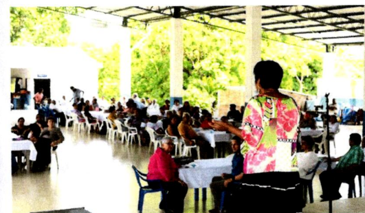
Celebración del Día del Maestro en Chinameca con la Asociación Nacional de Maestros Jubilados de El Salvador - ANMJES

INSTITUTO NACIONAL DE PENSIONES DE LOS EMPLEADOS PÚBLICOS