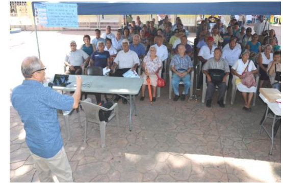
Presidente de INPEP participa en Servicio de INPEP-MÓVIL realizado fin de semana en Municipio de Santo Tomas