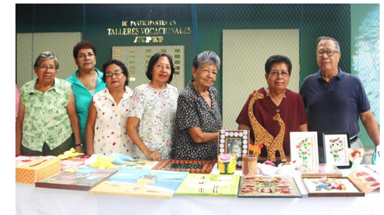
Feria de Logros de Talleres Vocacionales llevada a cabo en Oficina Central INPEP