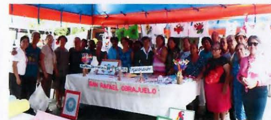
Exposición de artesanías del taller "Huellas Laboriosas La Paz" llevada a cabo en Oficina Central INPEP