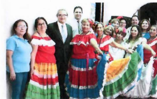
Exposición de Arte y Cultura en Oficina de Santa Ana