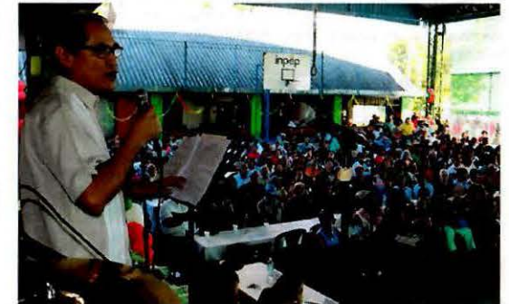
Convivio Navideño de Pensionados en Oficina Central