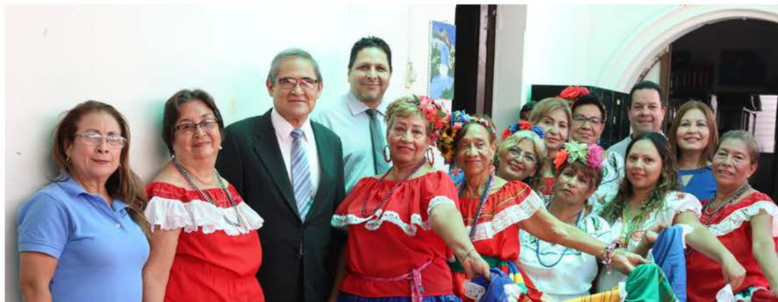
Evento artístico y exposición de artesanías en Oficina Departamental de Santa Ana