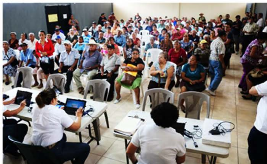
INPEP MÓVIL en Municipio de Zacatecoluca, Departamento de La Paz