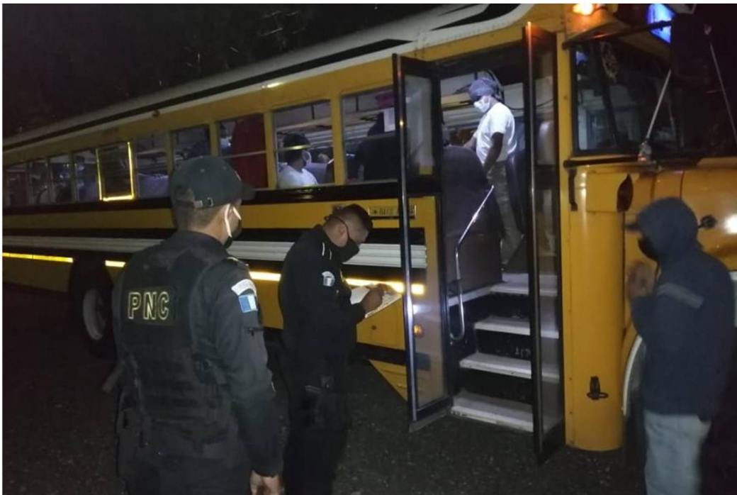
Población trasladada a centros de contención o albergues ante emergencia por INVIERNO o COVID19

Por otra parte cuando se evacuen a las personas de sus viviendas y sean trasladadas a los albergues, lo primero que se debe hacer es la evaluación médica, ya que en esa evaluación pueden salir personas hacia los centros de cuarentena por COVID 19, y otras que se quedarán en el albergue.