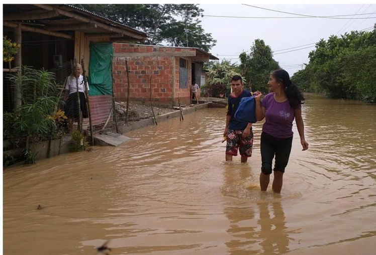
Inundaciones en las zonas de alto riesgo en Sonsonate.

Este recomendable es necesario en razón que actualmente no sólo el invierno afecta a la población sino también la Pandemia por COVID 19. Esta propuesta tiene la mirada de protección de las personas ante un deslave, deslizamiento, inundaciones, pero sin dejar de lado el riesgo de los contagios por COVID 19. El alto índice de casos en Sonsonate a la fecha es grande es por eso que hoy las recomendaciones de años anteriores deben modificarse, por eso se presenta esta propuesta de las recomendaciones para la Comisión Departamental de Protección Civil del departamento de Sonsonate, y las comisiones municipales de los 16 municipios del departamento de Sonsonate; en el marco de las lluvias por el invierno y la pandemia de COVID-19.