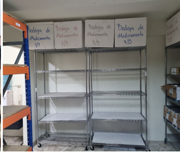
Servicio brindado por RANSA (JUNIO 2021)