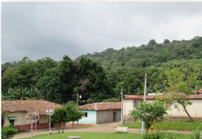
FIGURA No.1: PARTE DE LA PLAZA CENTRAL MUNICIPAL DE GUACOTECTI

Guacotecti cuenta con un Índice de Desarrollo Humano de 0.658, encontrándose en el puesto 185 dentro de los 262 municipios del país, ligeramente abajo del departamental que es de 0.666 y muy por abajo del municipio que posee el mayor índice a nivel nacional que es de 0.878 (Antiguo Cuscatlán, La Libertad).