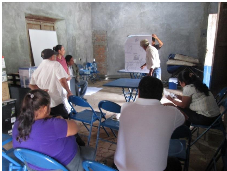
FIGURA No.3: RENION CON EL GRUPO GESTOR PARA EL ANALISIS DE LAS PRINCIPALES TENDENCIAS

El Concejo Municipal de Guacotecti está conformado por diez personas, 9 son hombres y una mujer. En cuanto al personal de la municipalidad un 29% (5) son mujeres y un 71% (12) son hombres. La experiencia en los puestos que desempeñan indica que la mayoría (88%) se han mantenido en los puestos, teniendo un nivel de rotación de