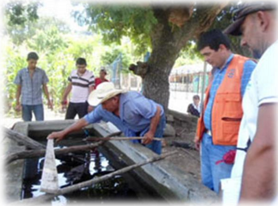
Figura N° 7: Integrantes del Comité Municipal de Protección Civil en campaña de abatización

Mejorar las condiciones ambientales y de seguridad ante desastres, a través del fomento de una cultura para el cuidado y manejo sostenible de los recursos naturales, así como para la prevención y reducción del riesgo de las familias y su entorno, con la participación activa de la comunidad.