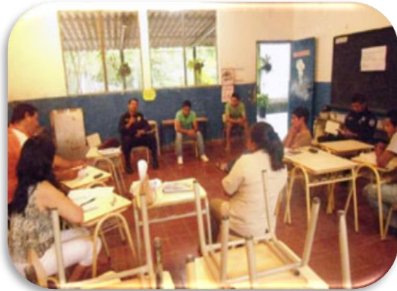
Figura Nº 5: Personal de PNC en acciones de prevención en centros escolares

Contribuir en mejorar las condiciones socio culturales de vida de la ciudadanía, a través del incremento en calidad y cobertura de servicios básicos de salud, educación; generando a su vez un municipio seguro a través de la prevención de la violencia en todas sus dimensiones y en alianza con las instituciones presentes en el municipio.