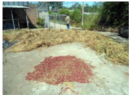
Figura Nº 6: Cosecha de frijol en San Isidro

Contribuir al desarrollo económico de San Isidro a través del fortalecimiento del sector agropecuario y el fomento de un tejido empresarial sólido y dinámico, capaz de generar las oportunidades de empleo y auto empleo que la población demanda para propiciarse una vida digna y en equilibrio con el medio ambiente.