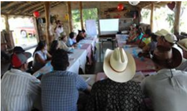
Figura N° 8: Capacitación a integrantes de ADESCO

Fortalecer las capacidades administrativas y de gestión del desarrollo, a través de la formación y actualización permanente del personal institucional y de los liderazgos del municipio, contando con el equipamiento necesario, actualizado, para brindar servicios oportunos y de calidad a la población, realizando una gestión basada en la transparencia y en la corresponsabilidad ciudadana.