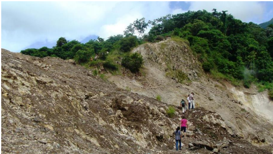
FIGURA Nº 4: ZONA DE DESLIZAMIENTOS EN CANTONES DE SAN ISIDRO

Las zonas de mayor vulnerabilidad ante las inundaciones son: El caserío La Junta en el cantón El Amate, Colonia El Tren, Hacienda Vieja, La Ladrillera, Hacienda Nueva, El Centro Escolar del cantón El Llano de la Hacienda, las Chamizas de Cerro de Ávila y la zona baja del río Titihuapa. Las zonas de mayor vulnerabilidad ante los deslizamientos de piedras, tierra, rocas, árboles, plantas y otros materiales son: La Junta del Cantón El Amate, Caserío Vainillas, Cantón Izcatatal Centro, Caserío el Amate, Horcones, Calle Nueva, Los Jobitos y Cerro de Ávila.