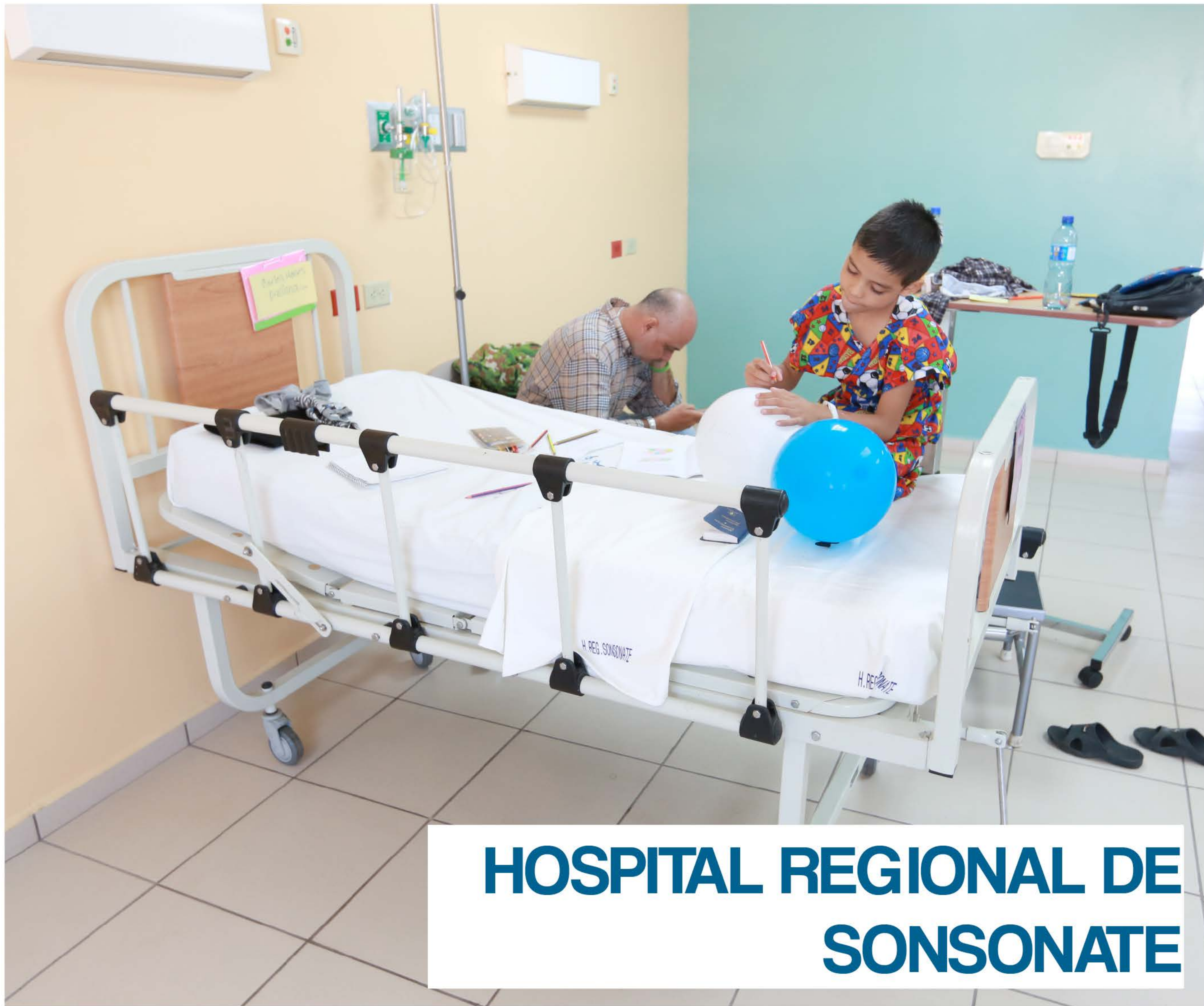
HOSPITAL REGIONAL DE SONSONATE

Más de 240 mil niños beneficiados en San Salvador, Santa Ana y Sonsonate