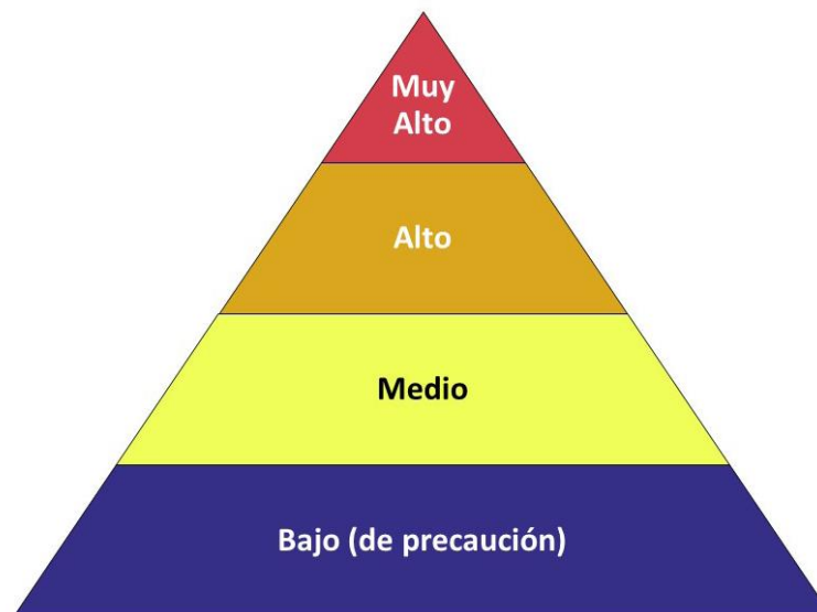
Figura G1 - Pirámide de riesgo ocupacional para el COVID-19

La pirámide de riesgo ocupacional muestra los cuatro niveles de exposición al riesgo en la forma de una pirámide para representar la distribución probable del riesgo.