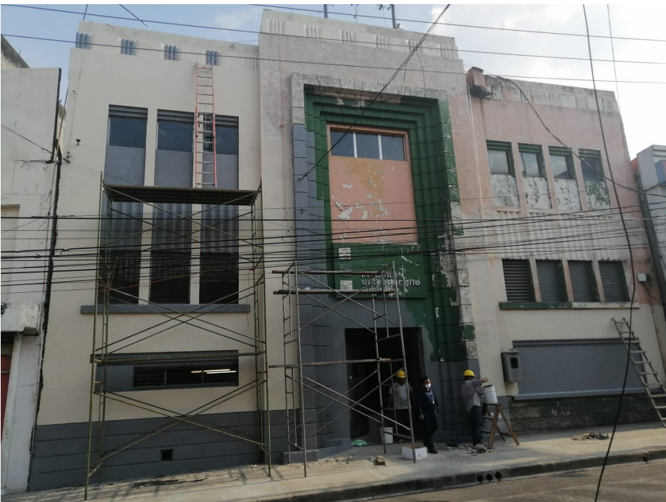
4-FACHADA EDIFICIO ISTU INTERVENCIÓN ACTUAL