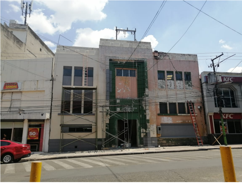
4-FACHADA INTERVENCIÓN ACTUAL