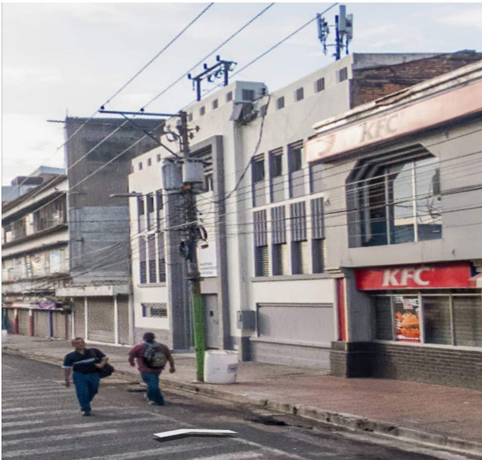
1-FACHADA EDIFICIO ISTU RUBEN DARIO

INFORMACIÓN ENTREGADA SOLICITUD REF. UAIP-003-2022