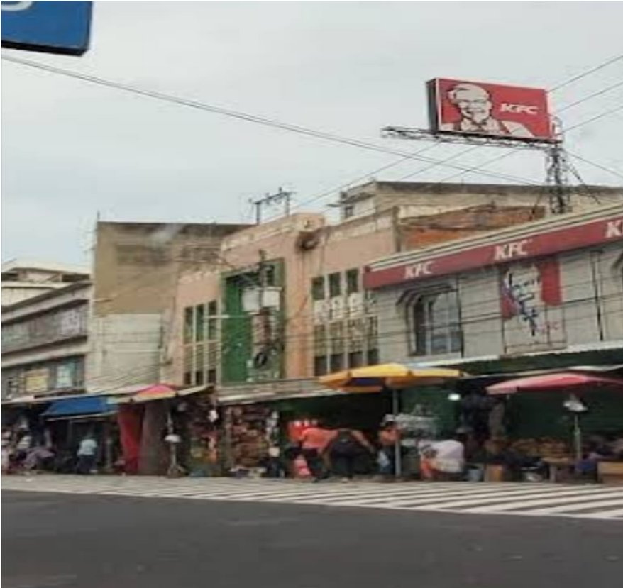
3-FACHADA EDIFICIO ISTU CON VENTAS