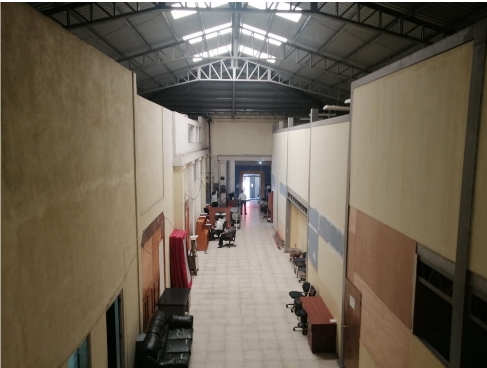
7-INTERIOR EDIFICIO ISTU-DARIO