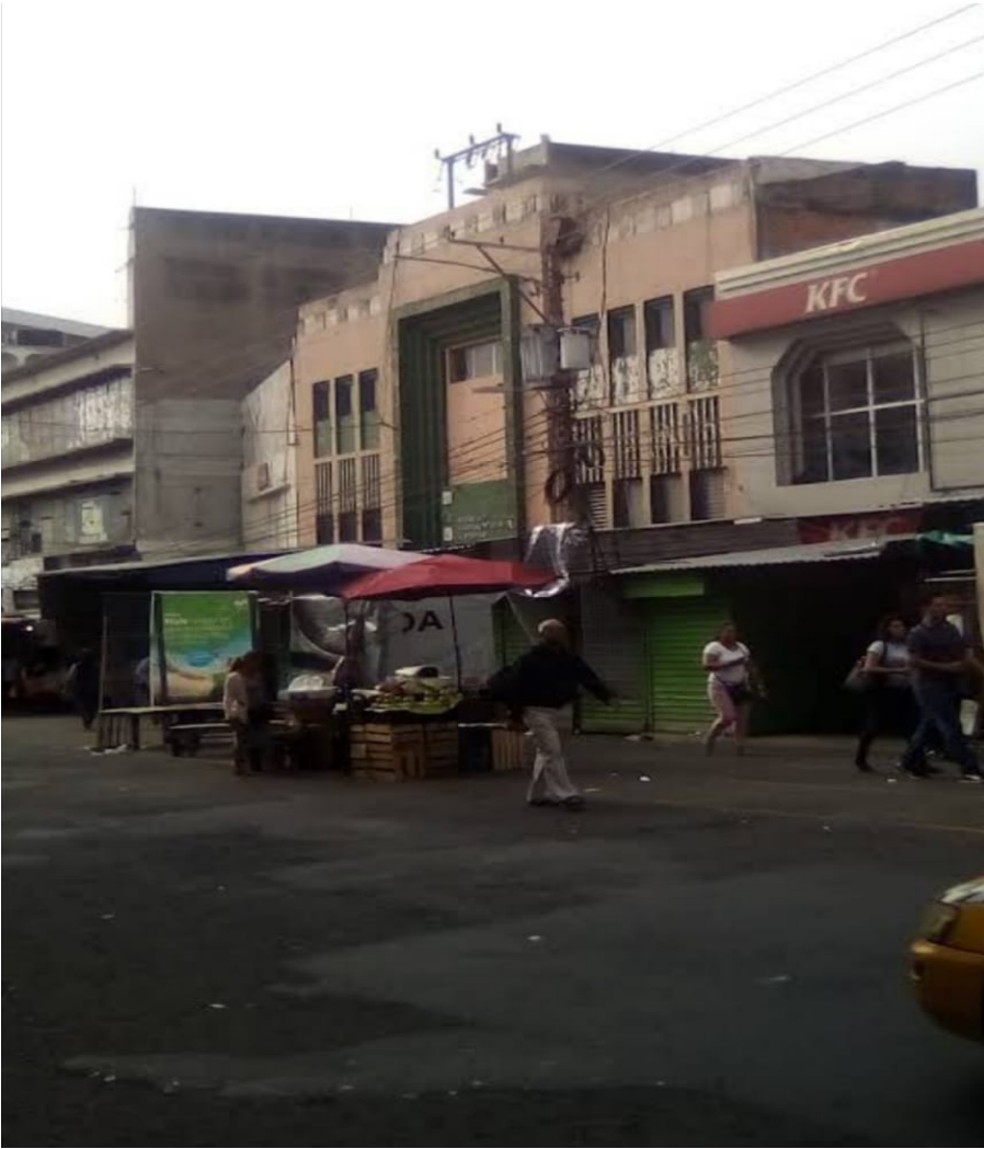
2-FACHADA DE EDIFICIO ISTU RUBEN DARIO CON VENTAS