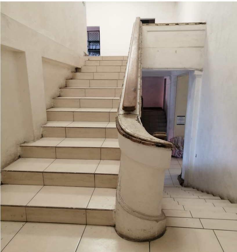
5-INTERIOR EDIFICIO ISTU – DARIO