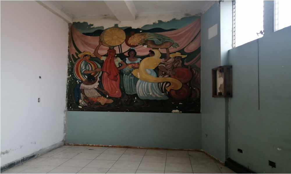
6-EDIFICIO ISTU DARIO INTERIOR