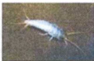
Pecicillo de Plata