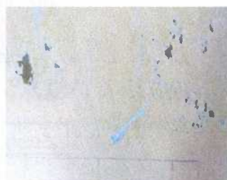
Documento dañado por pecicillo de plata