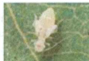
Piojo de Libro