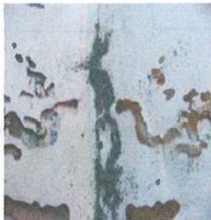
Documentos dañados por Termita de madera seca