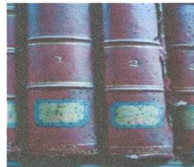
Documentos dañados por Escarabajo