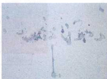
Manchas por regurgitación de cucaracha