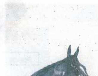
Manchas por excremento de cucarachas