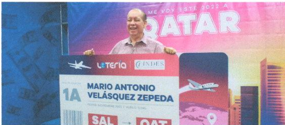
Pago de premios