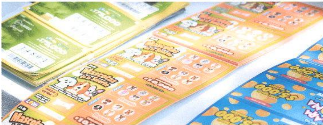
Venta de Billetes de Lotería Tradicional y Lotería Instantánea.