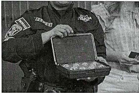
INVITADO MUESTRA MALETINES DE BALOTAS SELECCIONADOS