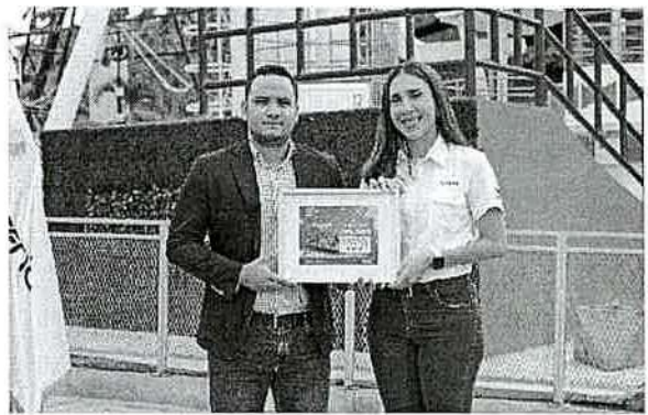
ENTREGA DE MARCO CONMEMORATIVO