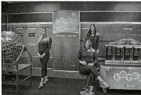
DESARROLLO DE SORTEO