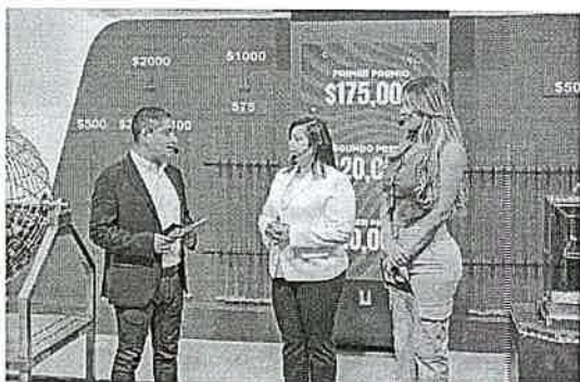
PALABRAS DE AGRADECIMIENTO