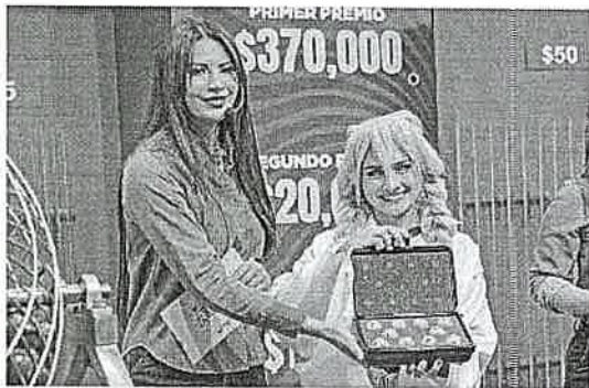
INVITADO MUESTRA MALETINES DE BALOTAS SELECCIONADOS