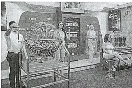
DESARROLLO DE SORTEO