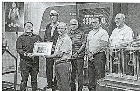
ENTREGA DE MARCO CONMEMORATIVO