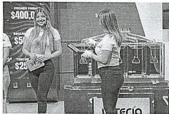
INTRODUCCIÓN DE BALOTAS A LA CÁMARA DE AIRE