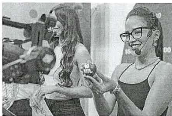
INVITADO MUESTRA LOS TRES PRINCIPALES PREMIOS