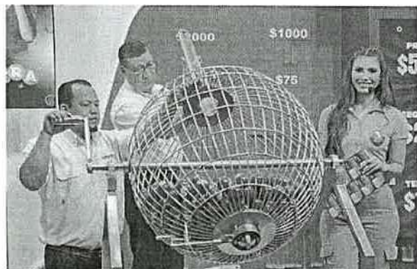
INTRODUCCIÓN DE BALOTAS A LA TÓMBOLA