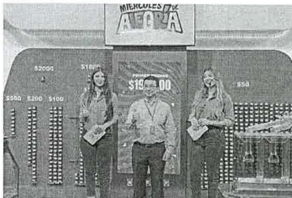
AVAL POR PARTE DEL INTERVENTOR DEL MINISTERIO DE HACIENDA