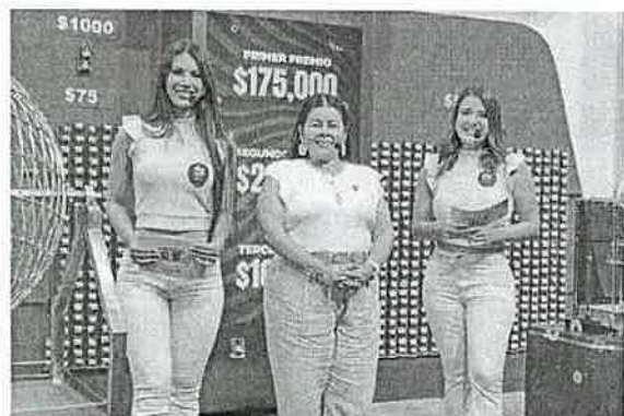
PARTICIPACIÓN DE INVITADO(S)