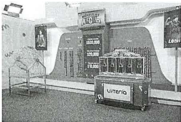
SET DE SORTEO Y BALOTAS DE PREMIOS