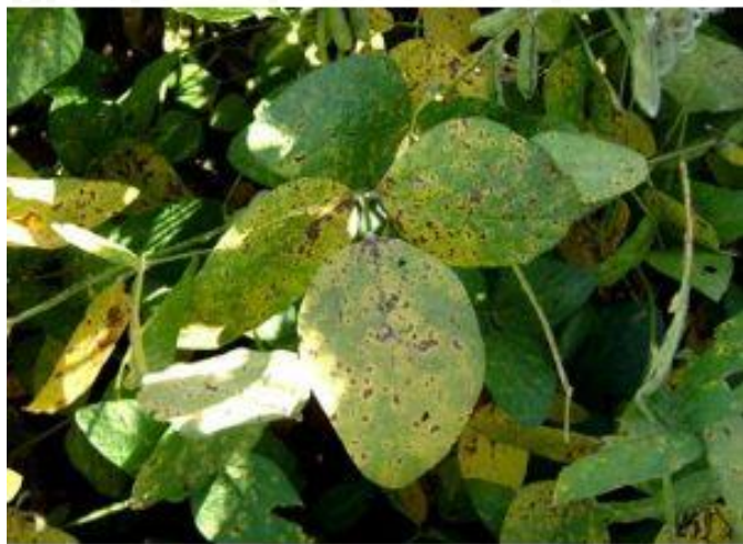
Planta enferma por hongo