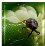
Picudo del Chile