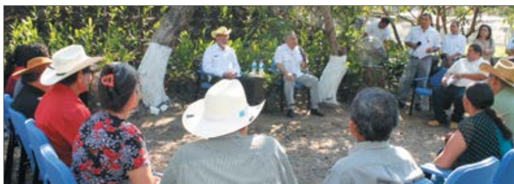
Ministro Orestes Ortez junto a productores Forestales.

Por tanto, es fundamental que el gobierno asuma un mayor protagonismo y apropiación de este instrumento y promueva la participación activa y comprometida de los sectores y actores involucrados en las actividades forestales, principalmente el sector profesional, tanto en su ejecución y eventual revisión, para aprovechar las externalidades positivas en el ámbito social, ambiental y económico