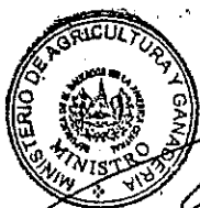
Lic. Orestes Fredesman Ortez Andrade Ministro de Agricultura y Ganadería

En fe de lo anterior, suscribimos este Convenio en dos originales de igual contenido y valor, debiendo quedar un ejemplar en poder de cada una de las partes que lo suscriben, en la ciudad de Santa Tecla, departamento de La Libertad, a los ocho días del mes de diciembre del año dos mil dieciséis.