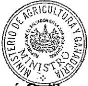
José Guillermo Belarmino López Suárez Ministro de Agricultura y Ganadería

En fe de lo anterior, suscribimos esta Carta de Entendimiento en tres originales de igual contenido y valor, debiendo quedar un ejemplar en poder de cada una de las partes que lo suscriben, en la ciudad de Santa Tecla, departamento de La Libertad, a los nueve días del mes de agosto del año dos mil once.