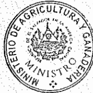
Pablo Salvador Anliker Infante Ministro de Agricultura y Ganadería