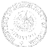
Pablo Salvador Anliker Infante Ministro de Agricultura y Ganadería