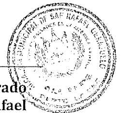
Rafael Amílcar Aguilar Alvarado Alcalde Municipal de San Rafael Obrajuelo