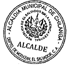
Pedro de Jesús Vásquez Martínez Alcalde Municipal de Chilanga