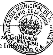
José Elenilson Leonza Alcalde Municipal de San Tecla