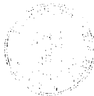
Pablo Salvador Anliker Infante Ministro de Agricultura y Ganadería