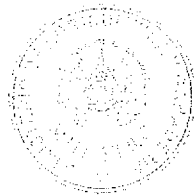
Pablo Salvador Anliker Infante Ministro de Agricultura y Ganadería